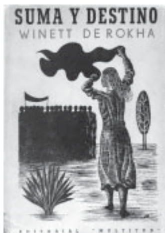
Santiago: Editorial Multitud, 1951.