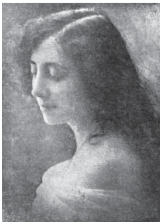
La joven de veinte años.