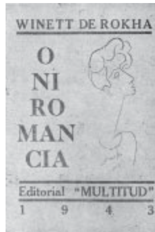
Oniromancia , publicado por la Editorial Multitud y con portada de su hija Lukó de Rokha, aparece en 1943.