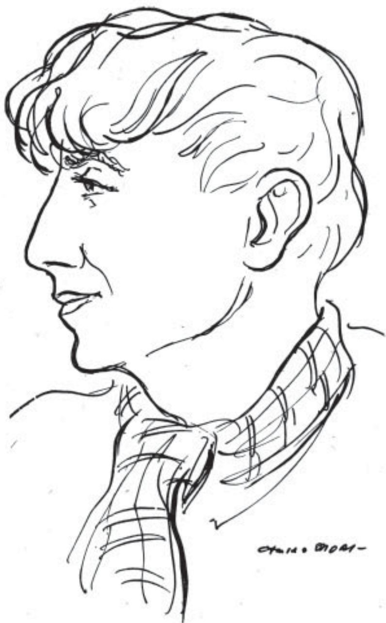
Retrato a lápiz de la poeta realizado por Camilo Mori.