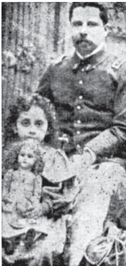
A los cuatro años con su padre y su muñeca “Bertita”, en Antofagasta.