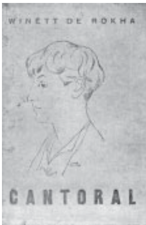
Portada de Pedro Olmos, Santiago, 1936.