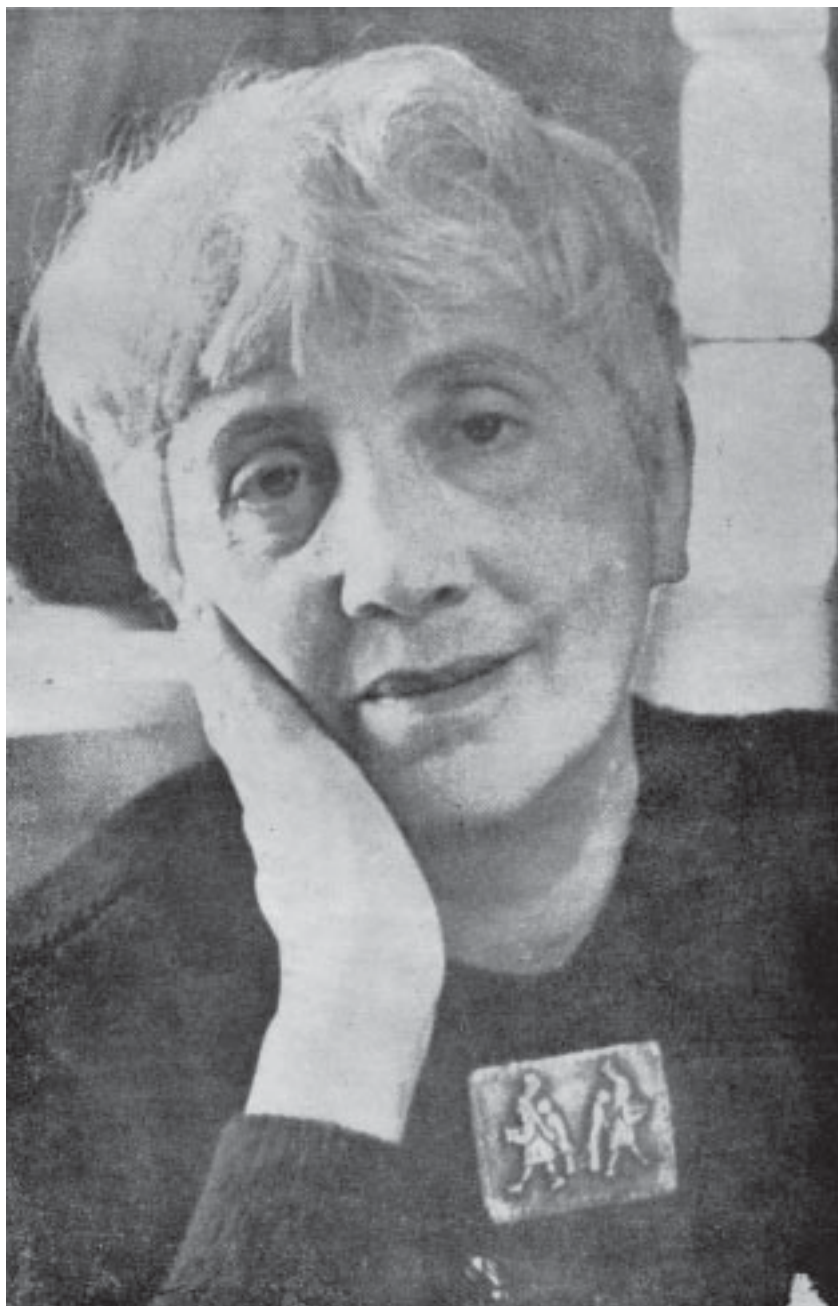
Una de sus últimas fotografías antes de fallecer víctima de cáncer, en 1951.