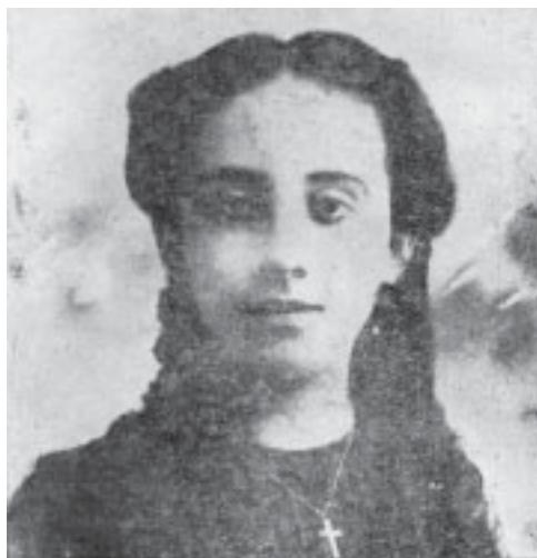
A los quince años.