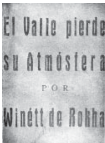
El valle pierde su atmósfera es un texto de 1949 que fue publicado e incluido en Arenga sobre el arte , libro compartido con Pablo de Rokha.