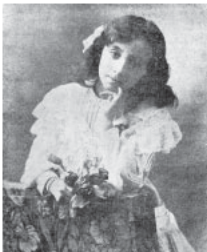
La niña que escribe versos y cuentos tristes.